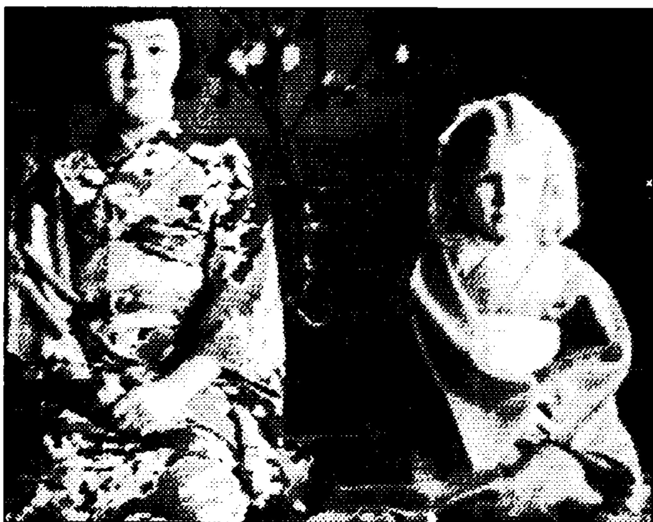
A sinistra la piccola Dacia con un'amica giapponese. La scrittrice si trovava a suo agio a Sapporo dove vivevano i Maraini; parlava perfettamente la lingua, andava a scuola con gli sci, mangiava cucina locale. A destra la famiglia al completo

«Sì. Lui continua a dire che c'è qualcosa che non capisce, qualcosa che lo inquieta. E, alla fine, Mayer scopre che il padre di lei, il nonno del ragazzo, era stato un generale dell'esercito nazionale fascista, lo stesso che aveva arrestato e mandato in Germania, in campo di concentramento, la famiglia di lui. Quindi è un momento terribile di scoperta: forse nemmeno lei lo sapeva, da bambina, perché era solo una bambina a quei tempi».