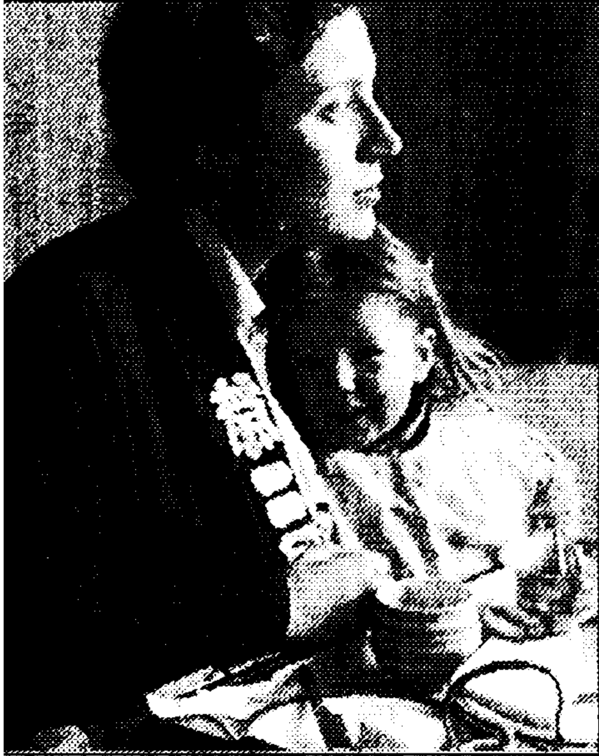
Dacia Maraini in braccio alla madre nella copertina del volume che racconta dei lunghi anni passati in Giappone al seguito del padre. A fianco la scrittrice oggi